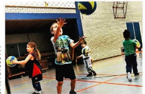
In de volleybalspeeltuin van Zovoc maken kleuters spelenderwijs kennis met de volleybalsport.

Doorstroom Nieuwe aanwas is voor elke vereniging van levensbelang. De jeugd is dan ook al enkele jaren een speerpunt van Zovoc en met succes.